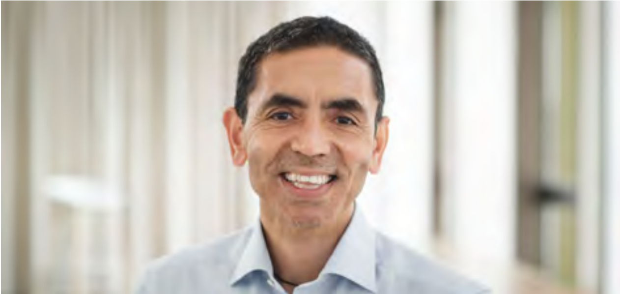
Prof. Dr. Ugur Sahin

Im Jahr 2008 gründeten Prof. Dr. Ugur Sahin und seine Frau Dr. Özlem Türeci als Spin-Off der Johannes Gutenberg-Universität Mainz das Unternehmen BioNTech. Begleitet von bedeutenden Investoren – darunter von Beginn an die MIG Fonds und das Strüngmann Family Office – entstand nach einer Start-Finanzierung von 150 Mio. Euro in nur etwa zwölf Jahren ein Global Player der Pharmabranche.