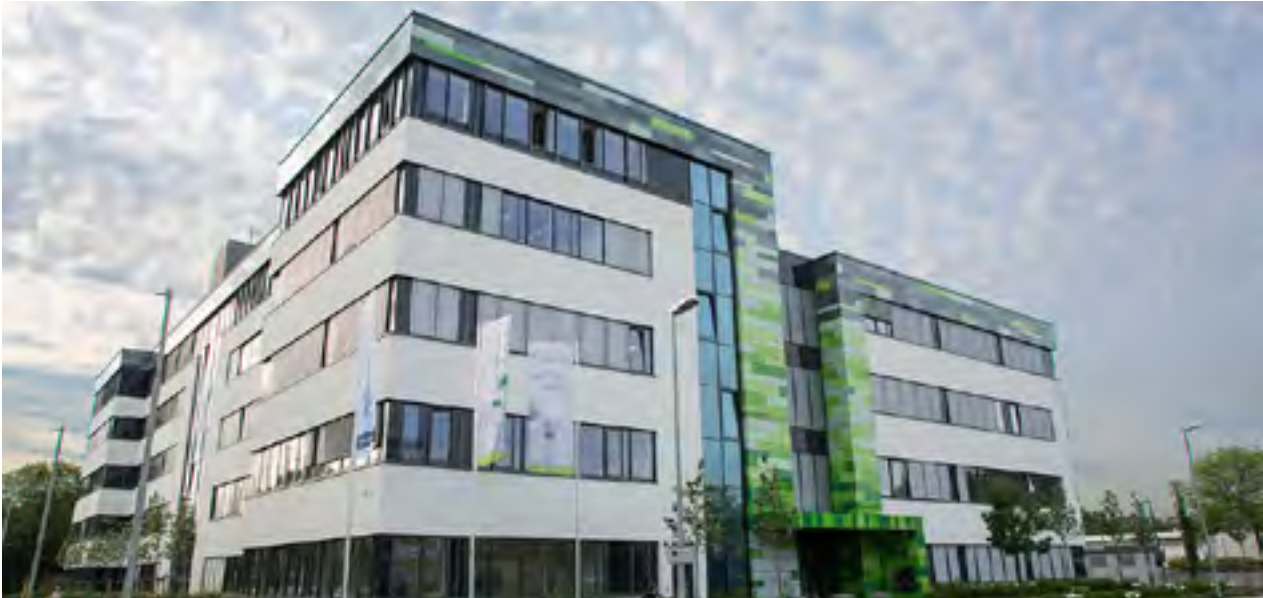
BioNTech's Headquarter in Mainz

erfolgreichsten Biotechpionieren Deutschlands und tun sich neben ihrer fachlich überragenden Expertise insbesondere durch ihre Überzeugungskraft bei Investoren hervor.