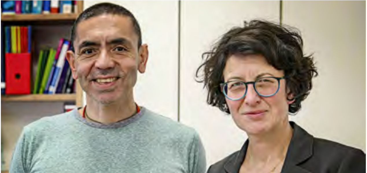
Prof. Dr. Ugur Sahin und Dr. Özlem Türeci

Einige erfolgreiche klinische Studien zeigen dazu bereits erfolgversprechende Ergebnisse und machen Hoffnung auf eine zeitnahe Markteinführung von Wirkstoffen.